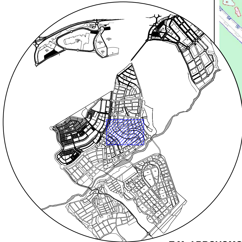
T.M. ARROYOMOLINOS 1/40.000